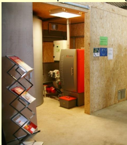
Houtsnipperkachel bij ANV-kantoor Wesepe

Het korte-omloopbosje met snelgroeiende wilgen en populieren van Biomassalland in Wesepe is niet zoals oorspronkelijk de bedoeling was voor de eerste maal afgezet. We hebben besloten het bosje door te laten groeien. Duitse leveranciers van het plantmateriaal kwamen ook tot de conclusie dat de wilgen en populieren bij ons wel erg hard waren gegroeid. Eén keer afzetten stimuleert uitstoeling, maar kost geld, omdat er dan weinig hout geoogst kan worden. Daarom is besloten om pas over twee jaar te oogsten. Vanuit de gemeente Raalte is er ook interesse om iets met Biomassalland op te starten. De gesprekken zijn gaande.