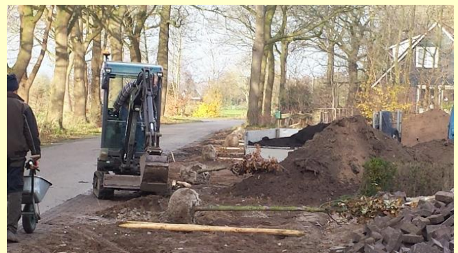
Bomen planten op erf voormalig garagebedrijf

Afgelopen winter hebben we ook een beplantings- en erfinrichtingsplan bij een voormalig garagebedrijf in Wesepe, dat de zgn. rood-voor-rood-regeling toepast, uitgevoerd. Een mooie en omvangrijke klus.