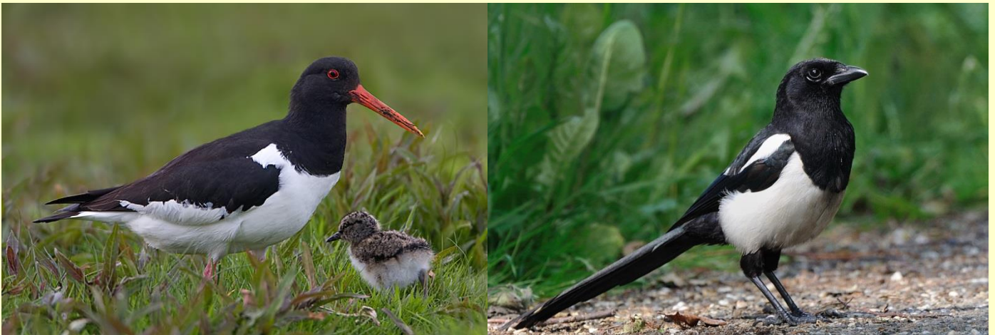
Scholekster met jong

kwikstaart zit voornamelijk in de kruidenrijke percelen waar volop voedsel te vinden is. Aangekomen op de Luttenbergerweg wordt mijn aandacht getrokken door het geschreeuw van twee eksters, op zoek naar voedsel. Ik geniet vanonder een boom van het prachtige tafereel en vraag me af wat de ekster en de scholekster eigenlijk gemeen hebben. Volgens mij alleen de kleur. Waar de ekster lomp en brutaal is, is de scholekster stil en verlegen. Op de terugweg, vlak bij mijn auto aangekomen, kan ik nog net een glimp opvangen van drie reeën, die mij wellicht eerder zagen dan ik hun. In een razend tempo verdwijnen ze weer uit het zicht. Mijn tocht zit erop. De eerste kieviten zijn aangekomen in hun broedgebied. Nu is het wachten op het eerste ei!