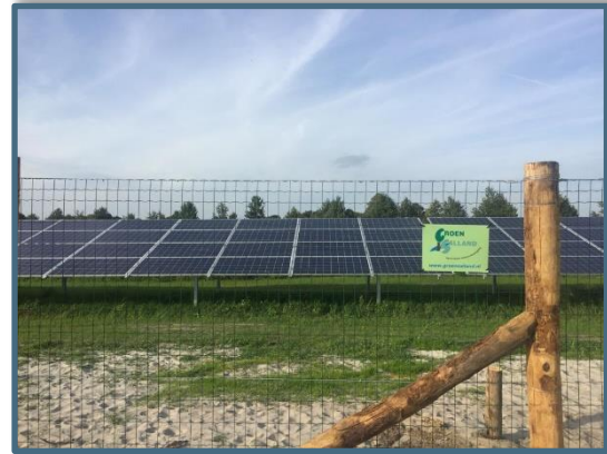
Nieuw hekwerk bij zonnepark

Voor het zonnepark van Endona Heeten heeft groen Salland het gehele hekwerk geplaatst. Een landelijk houten hekwerk; passend bij de omgeving. Deze gaat uiteindelijk nog geheel omlijnd worden door een gemengde heg die we hopelijk in november kunnen planten. Een mooie maar niet alledaagse klus. Gezien de plannen van diverse dorpen en gemeentes op het gebied van duurzame energie zullen er waarschijnlijk wel meer van deze initiatieven komen. Ook hierbij kan ANV Groen Salland van de partij zijn om de landelijke inpasbaarheid te realiseren.