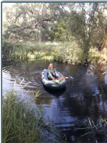
Met zaagpak de boot in voor verwijderen omgewaaid boom op eilandje van SBB

een rivier die op dit moment extreem laag staat; ruim 5 meter onder het hoogste niveau. Wanneer komt al dat water nou weer eens terug, denk je dan.