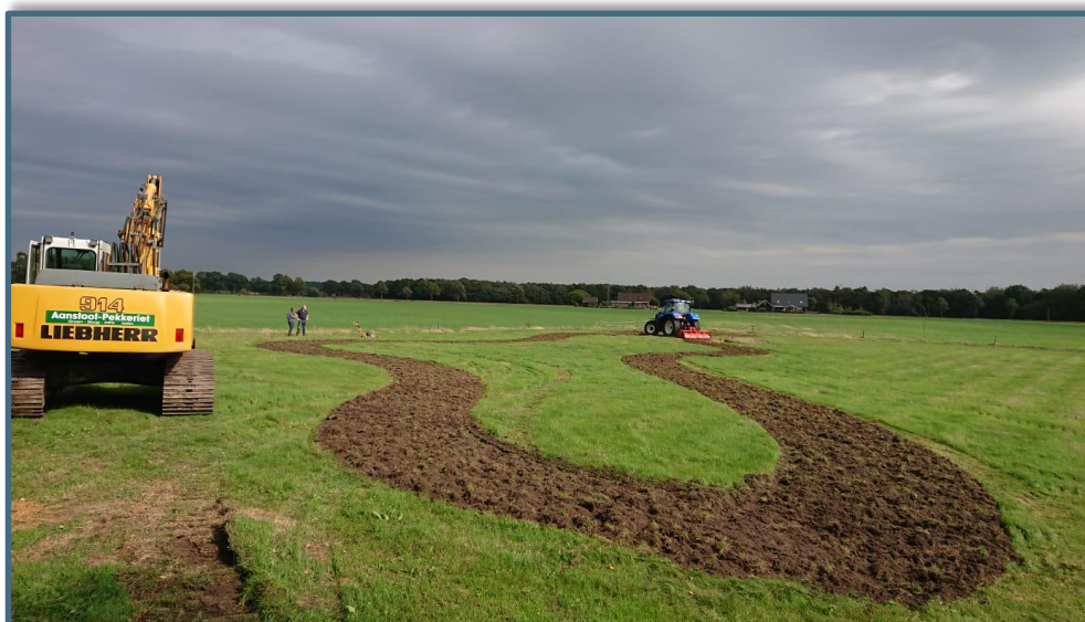
Aanleg nieuwe kikkerpoel in Haarle