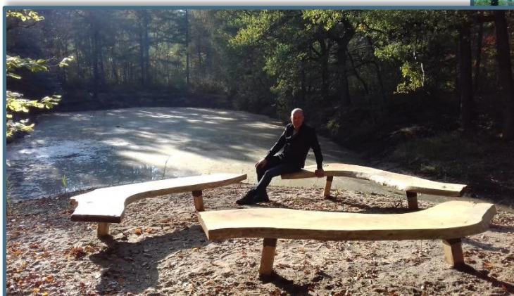
Eiken bank en aanleg trap in bos

Voor landgoed Frieswijk heeft ANV Groen Salland de grachten opgeschoond en gebaggerd. Dankzij de zeer lage waterstanden was dit goed te realiseren. De vrijgekomen bagger, voornamelijk blad, takken en modder, is op een naastgelegen stuk bouwland gelegd. Dit gaan we komende winter een aantal keren omzetten en met houtachtig materiaal verklepelen, om vervolgens volgend voorjaar weer uit te strooien op het bouwland. Ook hebben we daar nog 2 bostrappen gemaakt. Het geheel ziet er nu weer prachtig uit. Een paar eiken bankjes maakt het helemaal af... een prachtig resultaat.